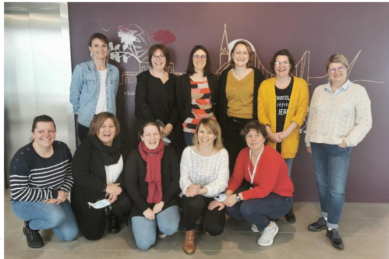
Le groupe de pilotage Bienveillance & Humanitude